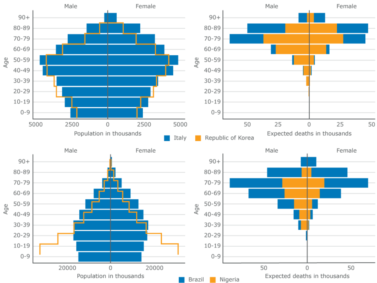
شکل ۱: مقایسه‌ی هرم جمعیتی ایتالیا و کره جنوبی، برزیل و نیجریه و مرگ و میرهای مورد انتظار با فرض نرخ ابتلای ۱۰ درصد جمعیت و نرخ مرگ و میر جاری ناشی از این بیماری به تفکیک سن و جنس

مورد نقشی که ساختارهای سنی جمعیت به تنهایی می‌توانند در همه‌گیر شدن بیماری داشته باشند، را ارائه می‌کند - با این فرض که عوامل دیگر یکسان هستند. نتایج نشان می‌دهد که در اروپا، تفاوت در ساختارهای سنی جمعیت می‌تواند موجب چهار برابر اختلاف در آمار مرگ و میر ناشی از بیماری کووید ۱۹ شود. نقشه زیر آسیب‌پذیری کشورهای اروپایی با جمعیت نسبتاً سالخورده با امکانات درمانی و بهداشتی کمتری را نشان می‌دهد. (شکل ۲)